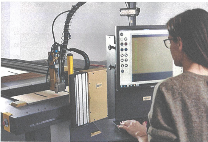
↑ Lepicí plotry Felix Gluer ONE přináší pokročilou automatizaci výroby.

Seznamte se s novou řadou lepicích stolových (flatbed) plotrů, které pomohou významně zvýšit produkci, a to nejen v obalářských provozech.