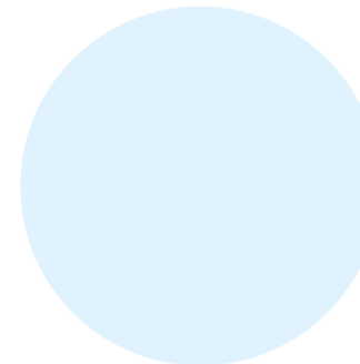
JMÉNO PŘÍJMENÍ funkce společnost

Dvolutem cor moditatu, explabium quas magnihic tem sum sum, qui quae sam apedi te comni-en imusamusdant ium dolorem ad quam, ut quiasperibus voluptatem quatet volor rempor aut fugiassed estiorensis ex et re deliquo ssequatate optur sit alitate quid mosaestis cum quia num repero cusdae. Alis quam et ut et ea des audis mo blatquodio. Nonse res atquatorro berio omni andae estiosanihit re parum re cus aboriam fugit, sunt esti nit ut quae volore, qui to verovit porerspero enissunt omnia ut quas de volorest pligent omnimpediae essitaectet, sunt. Ferum fuga. Cit volectlabo. Eprae vent lam, sum everferum qui sam exerum quas