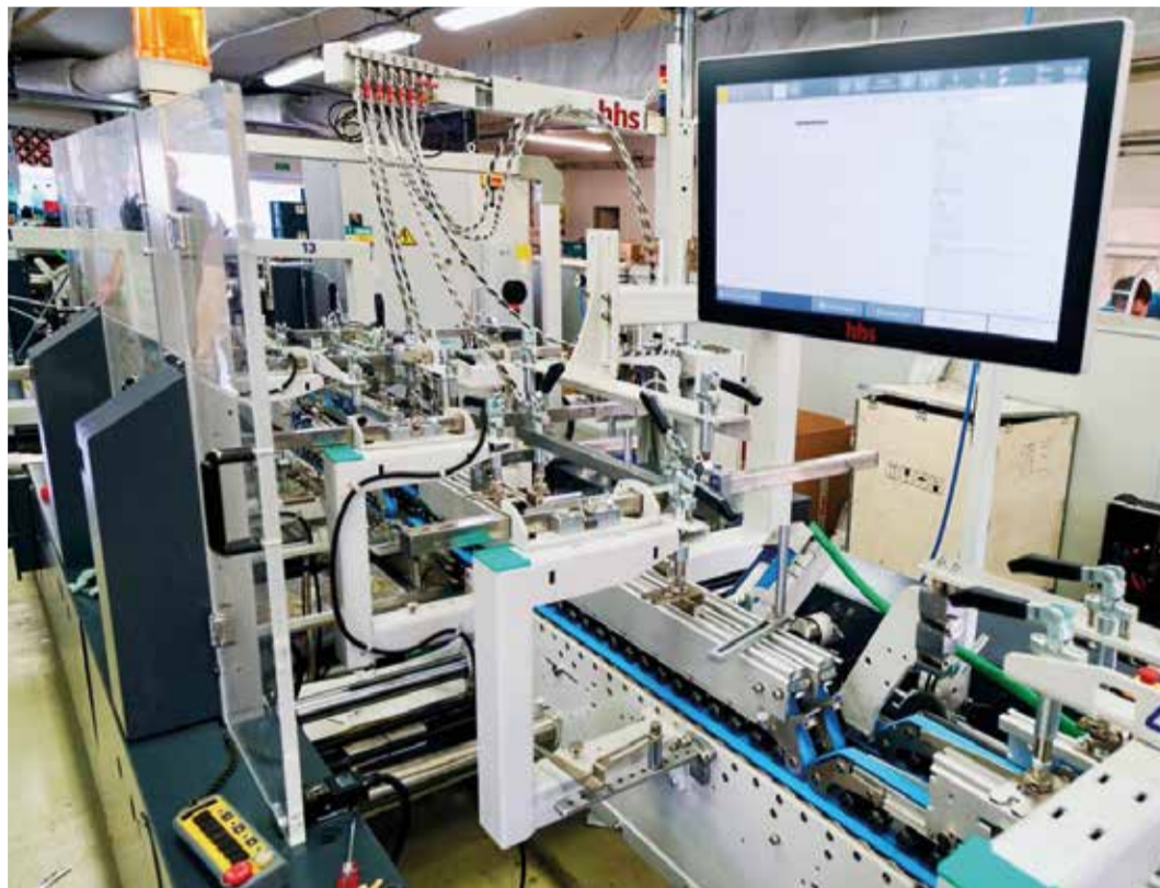
↑ Excepre odia eaquia exeria con corum veliquae re, sum.

Tento stroj může běžet rychlostí až 400m/min a je vybaven pokročilým a osvědčeným lepicím systémem HHS Xtend 3 s četnými ovládacími a kontrolními funkcemi synchronizovanými s integrovaným vyhadzovačem neshod-